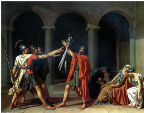
4A. J.L. David: El juramento de los Horacios . 1784.