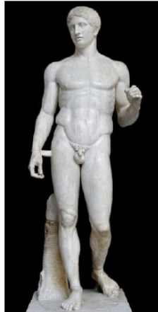
3A. Policleto: Doriforo . Siglo V a.C.