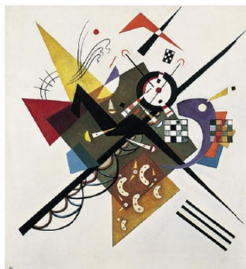
4B. Kandinski: En blanco II . 1923.